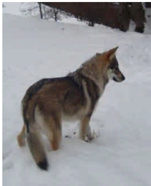
Photo 10 : queue épaisse et longue chez le chien