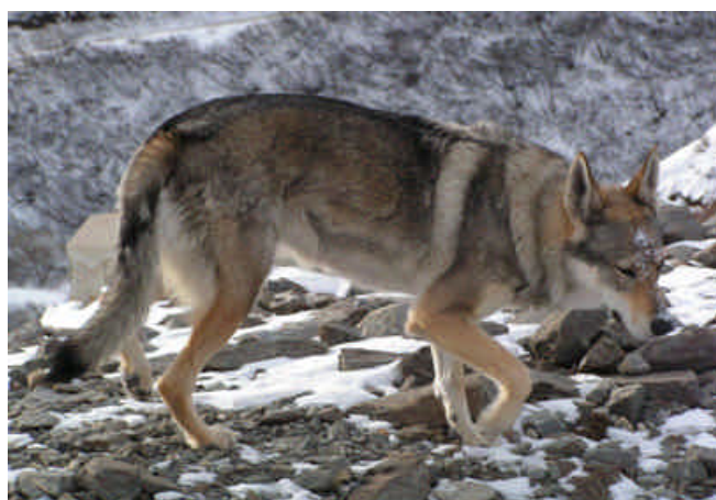
Photo 6 : Contrastes de couleurs et selle très marqués chez le chien