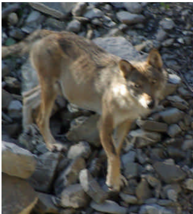
Photo 7 : plutôt courtes et arrondies chez le loup

- La forme et la taille des oreilles (photos 7 et 8) sont rarement renseignées dans les témoignages. Par contre, celles-ci sont facilement analysables sur photo. Elles sont plutôt plus courtes et arrondies chez le loup et longues en pointues chez le chien.