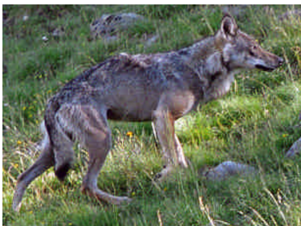
Photo 5 : pelage chamarré, dont les contrastes sont moins marqués chez le loup

- Le contraste de couleurs (blanc-gris-roux) et « selle » blanche en arrière des épaules (Photos 5 et 6) sont également des éléments souvent visibles. Très marqués chez le chien, il est en revanche très diffus sur le loup pour lequel le pelage apparaît à l'œil plus chamarré.