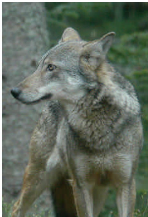
Photo 3 : masque labial peu étendu autour de la gueule chez le loup

- Le masque labial blanc est en revanche un élément qui frappe les observateurs (photos 3 et 4). Présent autour de la gueule chez le loup, il est cependant peu étendu et ne descend jamais sur le poitrail. Chez le chien-loup, celui-ci est également présent, mais de façon plus marquée et surtout s'étendant au poitrail ou aux pattes