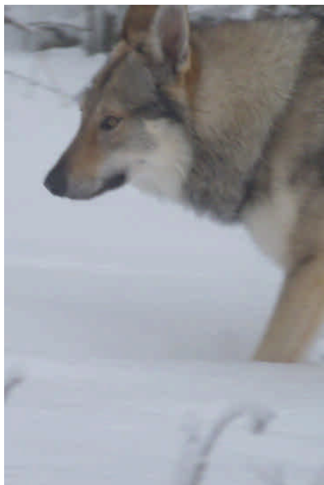
Photo 4 : masque étendu et très « tranché » chez le chien descendant jusqu'à la gorge ou aux pattes