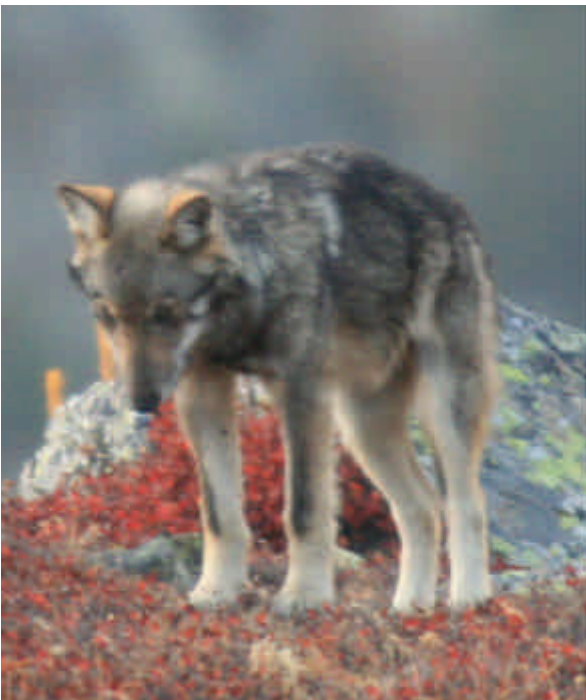
Photo 1 : liseré charbonné des pattes avant du loup souvent visibles de face en bonnes conditions

- La présence d'un liseré noir sur les pattes avant (photos 1 et 2), est permanente chez tous les loups de la lignée italienne (Cf. QDN 17). L'absence de liseré signifie donc qu'il ne s'agit pas d'un loup de lignée italienne (la réciproque n'étant pas vraie). Il est très rare que les chiens en possèdent ou du moins de façon nettement moins marquée. Si ce critère est facilement appréciable, animal en main ou photo proche, il est rarement observé en nature.